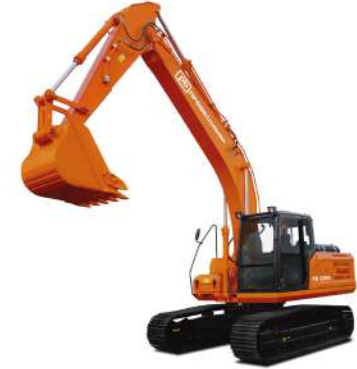
Экскаватор Профессионал RB225N Эксплуатационная масса 21,8 т Стандартный ковш 1,1 м³ Двигатель Cummins 6BTAAS9-C150 Номинальная мощность 112 кВт