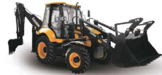
SIKUROVA 884 8,3 т, Perkins 74,5 кВт, 4WD