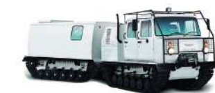
ГАЗ 3344 Грузоподъемность 3000 кг, Мест: 17