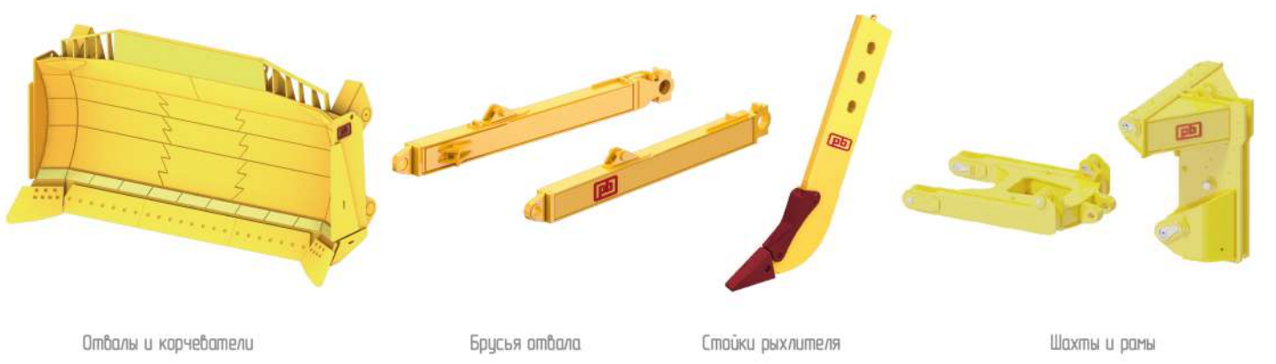
Отвалы и карчеватели Брусья отвала Стойки рыхлителя Шахты и рамы