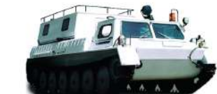
ГАЗ-34039-32 Грузоподъемность 1100 кг, Мест: 10