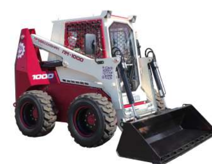
ММ-1000 Грузоподъемность 1000 кг, емкость ковшов 0,5 м³