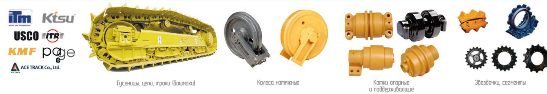
Гусеницы, цепи, траки (башмаки) Колеса накатные Катки опорные и поддерживающие Звездочки, сегменты