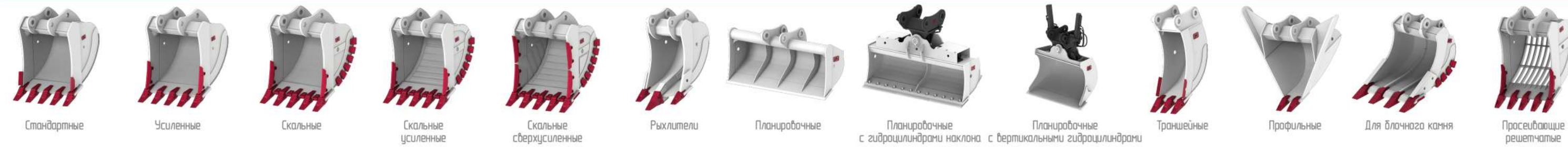
Стандартные Усиленные Скальные Скальные усиленные Скальные сверхусиленные Рыхлители Планировочные Планировочные с гидродлинными наклона с вертикальными гидродлинными Планировочные Траншейные Профильные Для блочного камня Прессующие решетчатые Экскаваторные Мультикошби лестчатые Фронтальные Обназубые рыхлители Мультирыхлители Мезорыхлители Бетонаторы