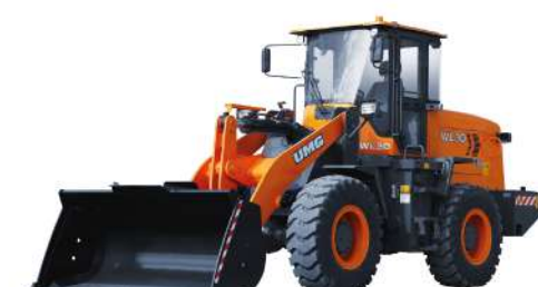
Фронтальные погрузчики WL 30: 10,5 т, Weichai, 92кВт, 17 м³, 2/п 3,0 м WL 50: 17,1 т, Weichai, 162 кВт, 3,0 м³, 2/п 5,0 м TL 155: 16,5 т, ЯМЗ 536, 14,0 кВт, 3,0 м³, 2/п 5,5 м TL 165: 21 т, ЯМЗ 536, 191 кВт, 3,2 м³, 2/п 6,5 м