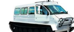
ГАЗ-34039 «Ирбис» Грузоподъемность 2000 кг, Мест: 12

8 (800) 250 09 65 8 (800) 250 40 80 ООО «Профессионал» – официальный дилер SIKUROVA, UMG, ANT, Трэкол, ЗЗГТ