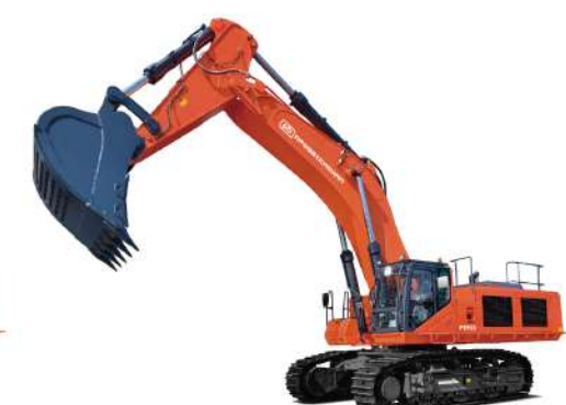
Экскаватор Профессионал RB950 Эксплуатационная масса 93,5 т Стандартный ковш 5,5 м³ Двигатель VOLVO PENTA TAD1643VE-8 Номинальная мощность 565 кВт