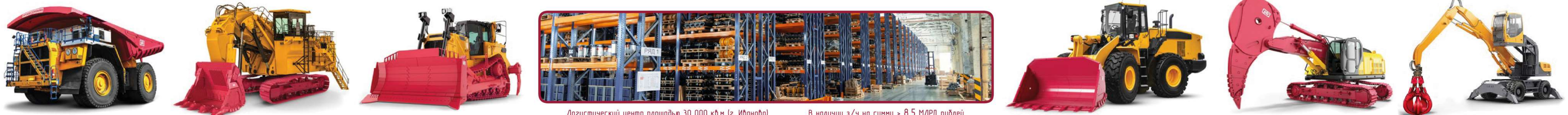
Логистический центр площадью 30 000 кв.м (г. Иваново) В наличии з/ч на сумму > 8,5 МЛРД рублей