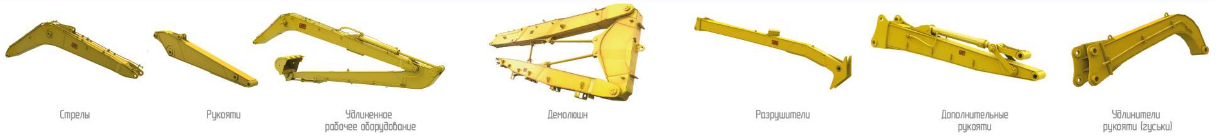
Стрелы Рукояти Удлиненное рабочее оборудование Демолиты Разрушители Дополнительные рукояти Удлинитель рукояти (гуськи)