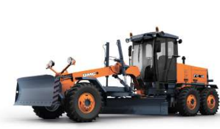
Амфиголедеры ГС 14.02; 13,5 т, ЯМЗ 236 Г6, 110 кВт, 1x2x3 АГ 14.0; 14,5 т, ЯМЗ-236Г-16, 110 кВт, 1x2x3 АГ 180; 16,9 т, ЯМЗ-236М2-73, 132 кВт, 1x2x3 ДЗ 250; 19,7 т, ЯМЗ-238НД3, 173 кВт, 1x3x3