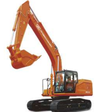
Экскаватор Профессионал RB245 Эксплуатационная масса 25,8 т Ковш скальный 1,3 м³ Двигатель Cummins QSB6.7-C190-31 Номинальная мощность 145 кВт