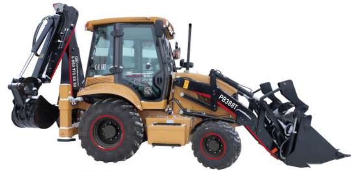
RB388T 8,9 т, Cummins, 4BTA3.9-C100, 74кВт; Мосты и КПП Synchro Shuttle, np-bo Carraro, Аксиальный насос Hentl; SRS; 4WD