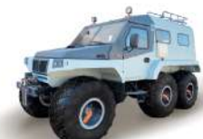
Вега Грузоподъемность 600 кг, Мест: 8, Шины 1300x600-533