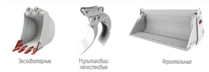
Экскаваторные Мультикошби лестчатые Фронтальные