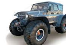
39041 Грузоподъемность 450 кг, Мест: 5, Шины 1300x600-533