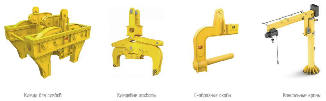
Клещи для слэбов Клещевые захваты С-образные скобы Консольные краны