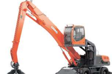
Экскаваторы-перезарядители Е 230 WH: 23,4 т, ЯМЗ 534, 132 кВт