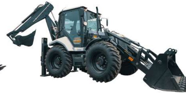
SIKUROVA 888XG 8,9 т, Perkins 74,5 кВт, 4WD, Крабовый ход