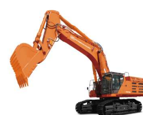
Экскаватор Профессионал RB700 Эксплуатационная масса 69 т Ковш скальный 4,4 м³ Двигатель WP15H Номинальная мощность 566 кВт