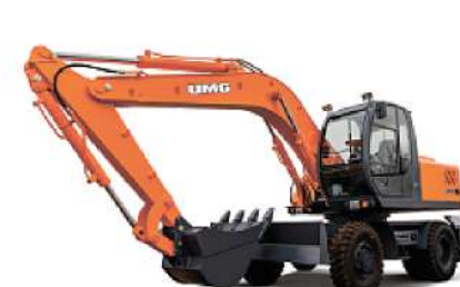
Колесные экскаваторы Е 170W: 17,5 т, ЯМЗ 534.93, 88 кВт, 1,0 м³ Е 185W: 17 т, Д 245, 77 кВт, 1,0 м³ Е 200W: 18,5 т, ЯМЗ 534.29, 119 кВт, 1,0 м³