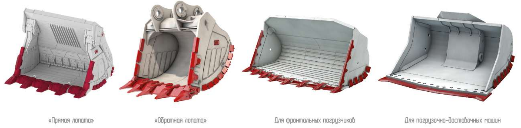
«Прямая лопата» «Обратная лопата» Для фронтальных погрузчиков Для погрузочно-доставочных машин