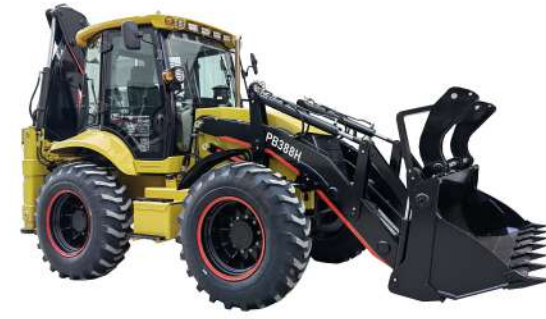
RB388H 10,6 т, Cummins, 4BTA3.9-C100, 74кВт; КПП Powershift, Мосты Carraro, Аксиальный насос Hentl; SRS; 4WD; Крабовый ход