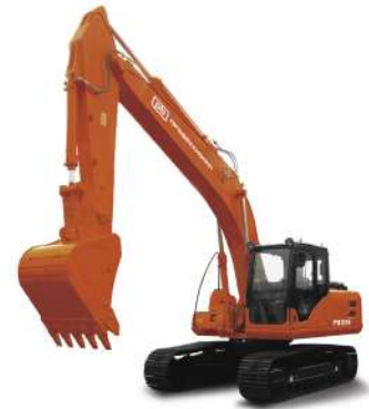
Экскаватор Профессионал RB225 Эксплуатационная масса 21,8 т Стандартный ковш 1,2 м³ Двигатель Cummins 6BTAAS9-C150 Номинальная мощность 112 кВт