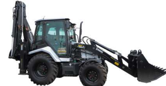
SIKUROVA 885XG 8,6 т, Perkins 74,5 кВт, 4WD, Двухступ.