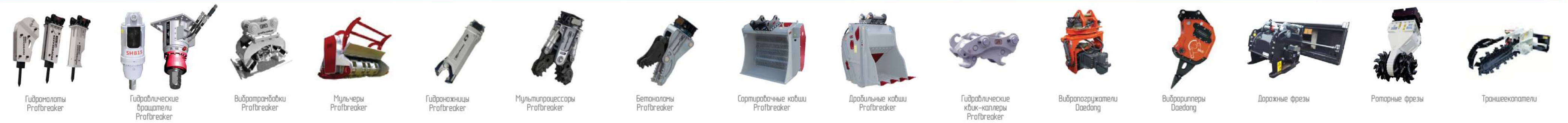
Гидромолоты Profbreaker Гидравлические брашеры Profbreaker Вибробраковки Profbreaker Мульчеры Profbreaker Гидробиты Profbreaker Мультипроцессоры Profbreaker Бетонаторы Profbreaker Сортировочные ковши Profbreaker Дробильные ковши Profbreaker Гидравлические кюк-калперы Profbreaker Вибропозрикатели DaeDang Вибропилеры DaeDang Дорожные фрезы Роторные фрезы Траншекопатели