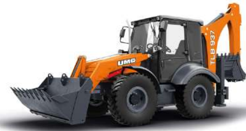
Экскаватор-погрузчик TLB827: 8,3 т, Perkins 1104-C-44T, 68,5 кВт; TLB937: 8,8 т, Perkins 1104D, 74 кВт;