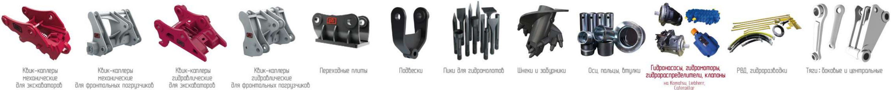
Кюк-калперы механические для экскаваторов Кюк-калперы механические для фронтальных погрузчиков Кюк-калперы гидравлические для экскаваторов Кюк-калперы гидравлические для фронтальных погрузчиков Переходные плиты Подвески Пилы для гидромолотов Шнеки и забурники Оси, пальцы, втулки Гидронасосы, гидромоторы, гидрораспределители, клапаны на Komatsu, Liebherr, Caterpillar РВД, гидроработки Тяги: боковые и центральные