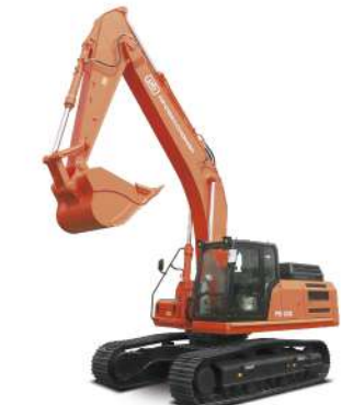
Экскаватор Профессионал RB330 Эксплуатационная масса 32,8 т Ковш скальный 1,6 м³ Двигатель Isuzu 6N-6HK1/ DECC Cummins 6L8.9-C325 (Tier 2) Номинальная мощность 212/241 кВт