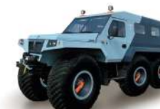
Хаски Грузоподъемность 2000 кг, Мест: 8, Шины 1600x700-635