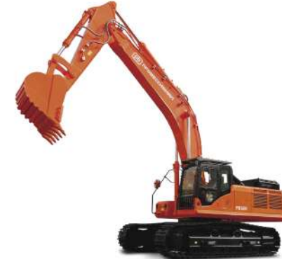
Экскаватор Профессионал RB500 Эксплуатационная масса 50,5 т Ковш скальный 2,6 м³ Двигатель Isuzu 6WG1-XDHAG-03-C3 Номинальная мощность 300 кВт