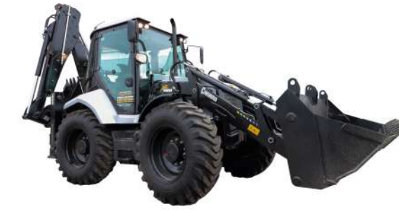
SIKUROVA 888XL 8,9 т, Perkins 74,5 кВт, 4WD, Крабовый ход