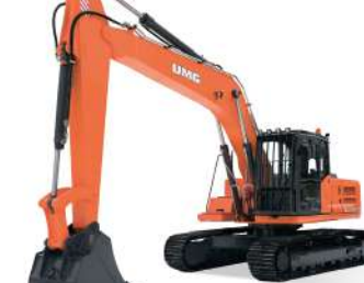
Гусеничные экскаваторы Е 225 С: 23 т, ЯМЗ-536, 147 кВт, 1,0 м³ Е 225 NC: 22,7 т, ЯМЗ-536, 147 кВт, 0,9 м³ Е 248 С: 23,7 т, ЯМЗ-536, 147 кВт, 1,2 м³ Е 330 С: 33 т, ЯМЗ-536, 190 кВт, 1,6 м³