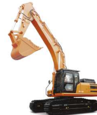
Экскаватор Профессионал RB400 Эксплуатационная масса 39,3 т Ковш скальный 1,9 м³ Двигатель Isuzu 6N-6HK1/ DECC Cummins 6L8.9-C325 (Tier 2) Номинальная мощность 212/241 кВт