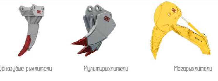
Обназубые рыхлители Мультирыхлители Мезорыхлители