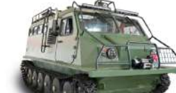
ГАЗ-34039-62 Грузоподъемность 2000 кг, Мест: 13