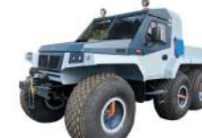
Вега Пикап Грузоподъемность 600 кг, Мест: 4, Шины 1300x600-533