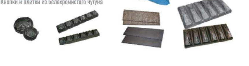
Кнопки и плитки из белогохромистого чугуна