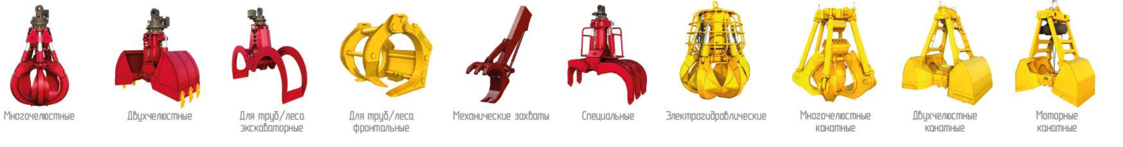
Многочелюстные Двучелюстные Для труб/леса экскаваторные Для труб/леса фронтальные Механические захваты Специальные Электрогидравлические Многочелюстные канатные Двучелюстные канатные Моторные канатные